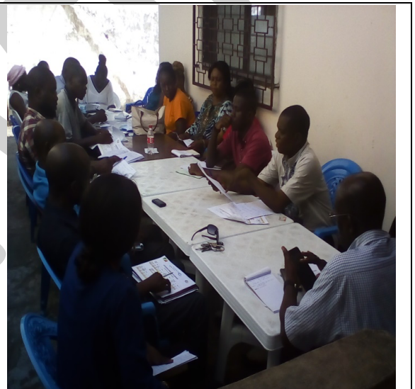
Le siège de notre Association est situé au fond Tié-Tié, arrêt Moulembo, 846, Av de l'Indépendance. Ici, nos membres en pleine séance de travail