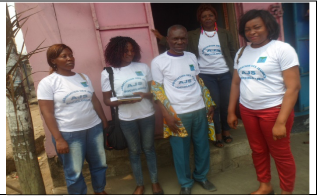
Organisation des campagnes de sensibilisation L'équipe des animateurs au sortir d'une campagne