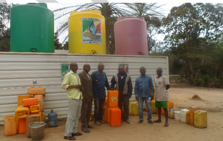
Diagnostic communautaire dans le Kouilou, l'Association des Jeunes Sociologues et l'ADH