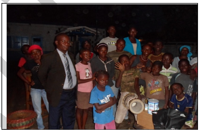
Campagne de sensibilisation sur les droits des enfants à Makola