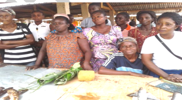
Appui et accompagnement de la Coopérative COFVAP par l'Association des Jeunes Sociologues AJS